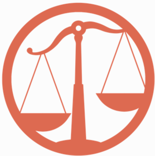
Spravedlnost & Rovnost